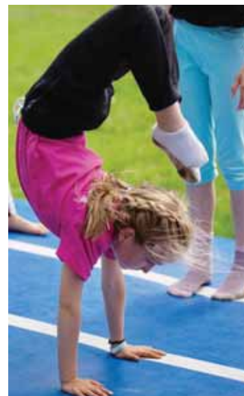
Lors de la journée des membres, démonstration des très jeunes gymnastes du club.